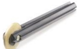
Rodel PLUS Ø 22 mm. GOLD