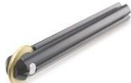
Rodel PLUS Ø 18 mm. GOLD