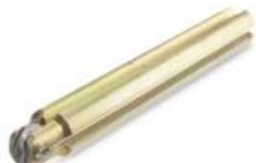
Rodel PLUS Ø 10 mm.