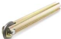
Rodel PLUS Ø 18 mm.