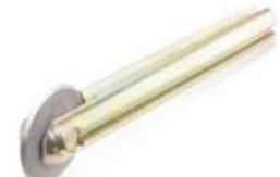
Rodel PLUS Ø 22 mm.