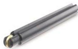
Rodel PLUS Ø 10 mm. GOLD