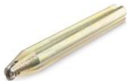
Rodel PLUS Ø 8 mm.